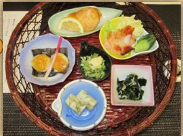
花籠(はなかご)弁当